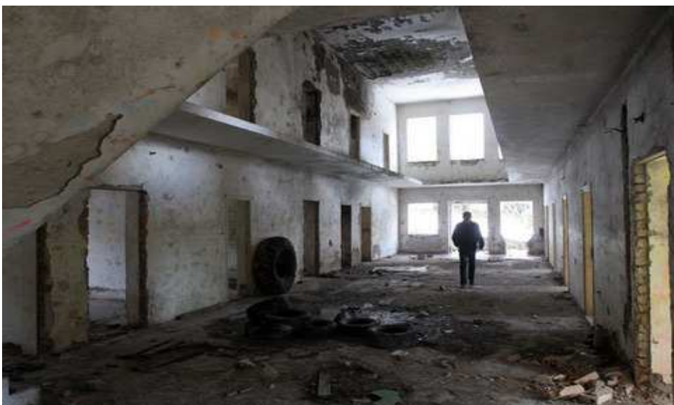
Obrázek 3. Důl Adam v Jáchymově