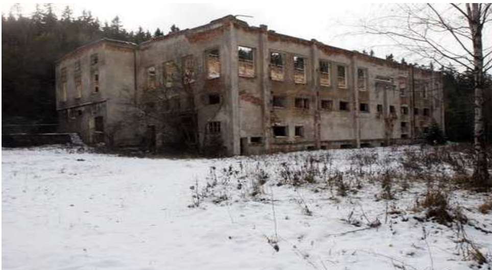
Obrázek 2. Ohromná budova měnárny nazývaná „turbo“