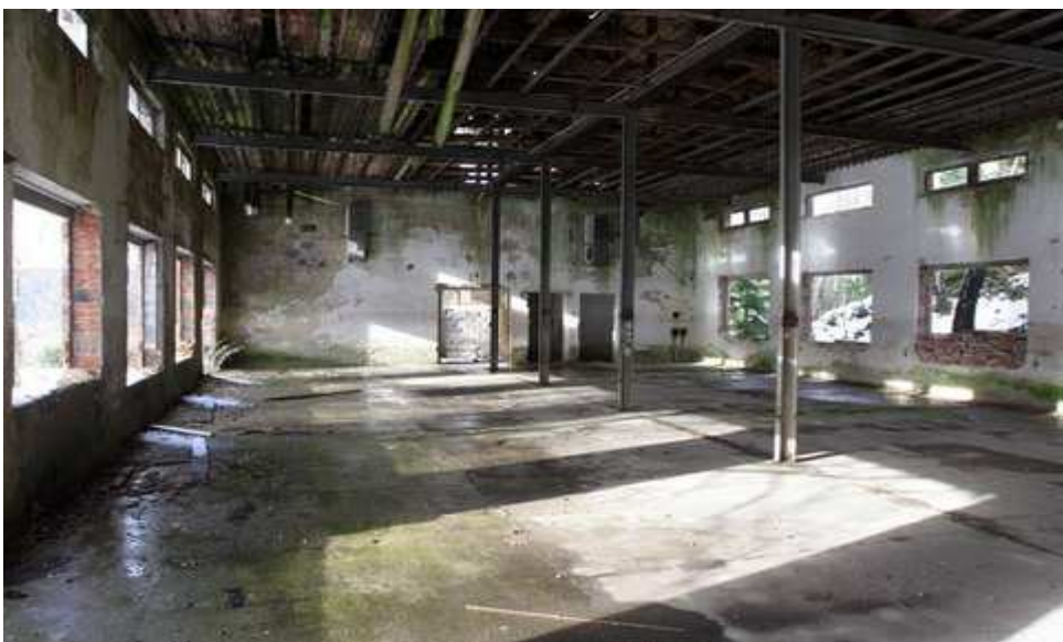
Obrázek 3. Budova šaten