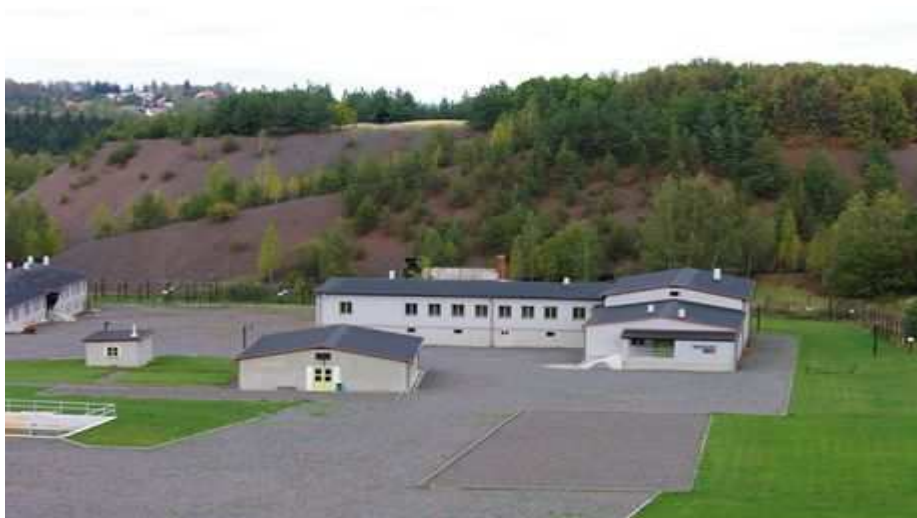
Obrázek 8. Pohled na tábor