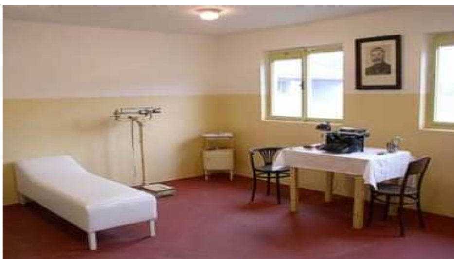
Obrázek 11. Ošetřovna