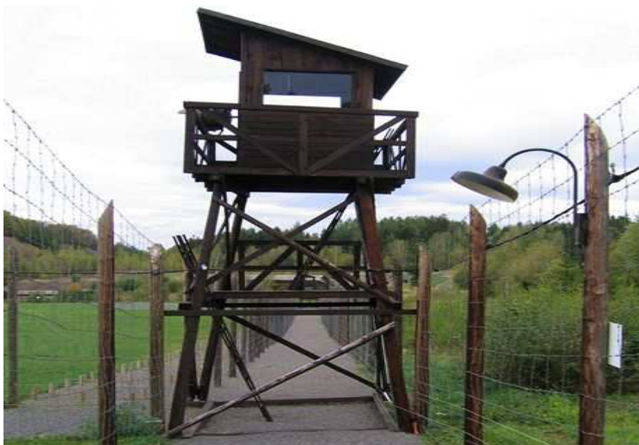
Obrázek 9. Strážní věž