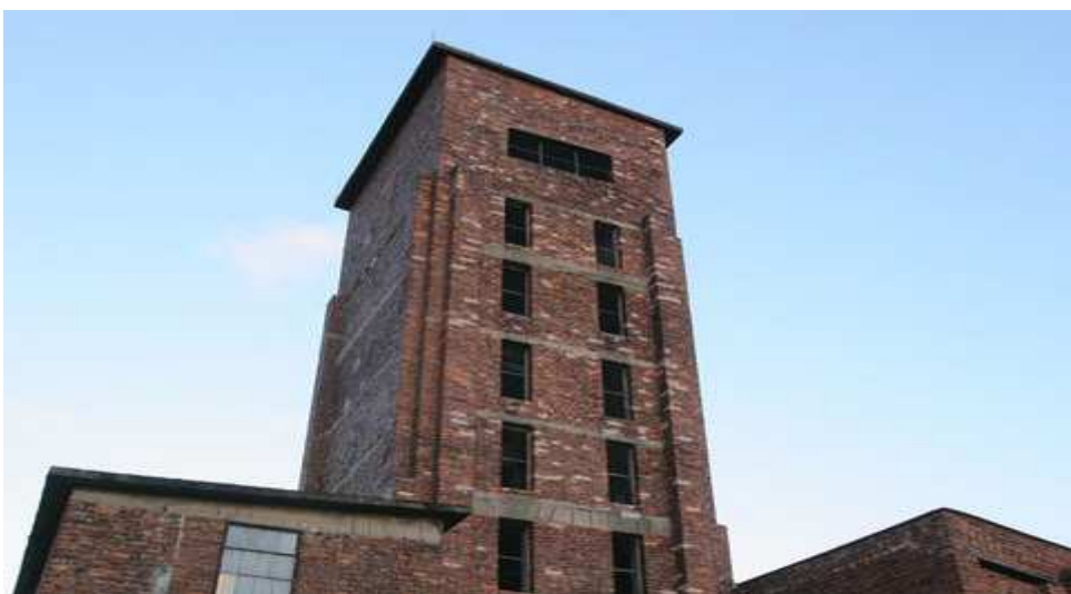
Obrázek 6. Rudá věž „Věž smrti“ - pracoviště lágru ve Vykmánově s krycím označením "L"