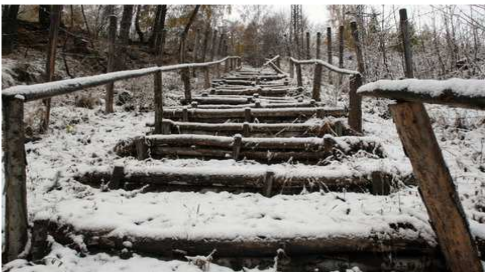
Obrázek 5. Od šachty vedle do tábora 260 strmých schodů. Do tábora se po nich nosila i voda.