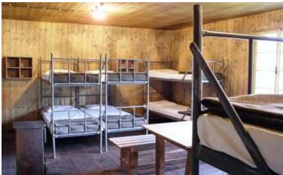
Obrázek 10. Ubytovna G