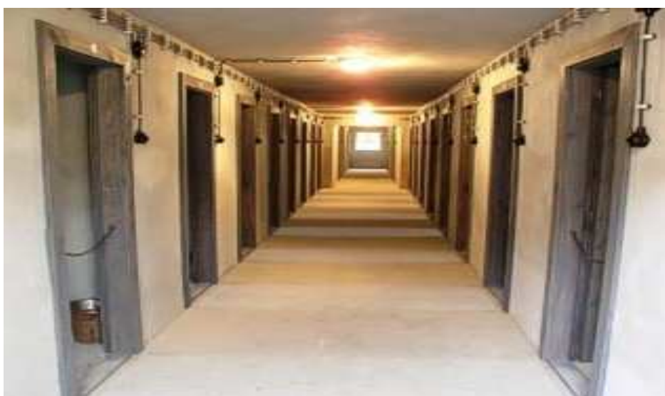
Obrázek 12. Korekce