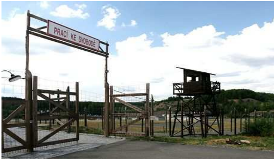
Obrázek 7. Pracovní tábor Vojna u Příbrami