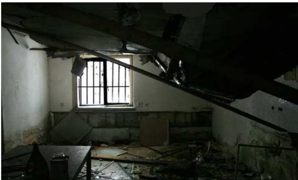
Obrázek 4. Lágr Barbora