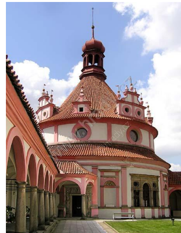
Roundel in Jindřichův Hradec