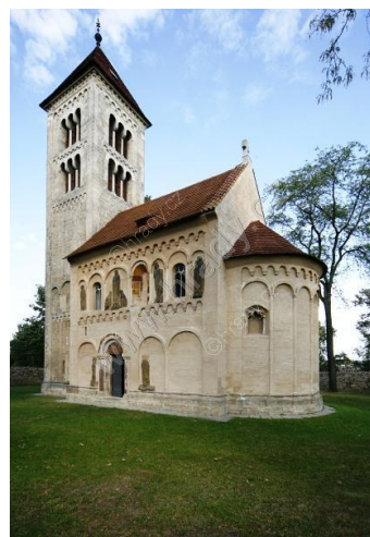
Jakub near Kutná