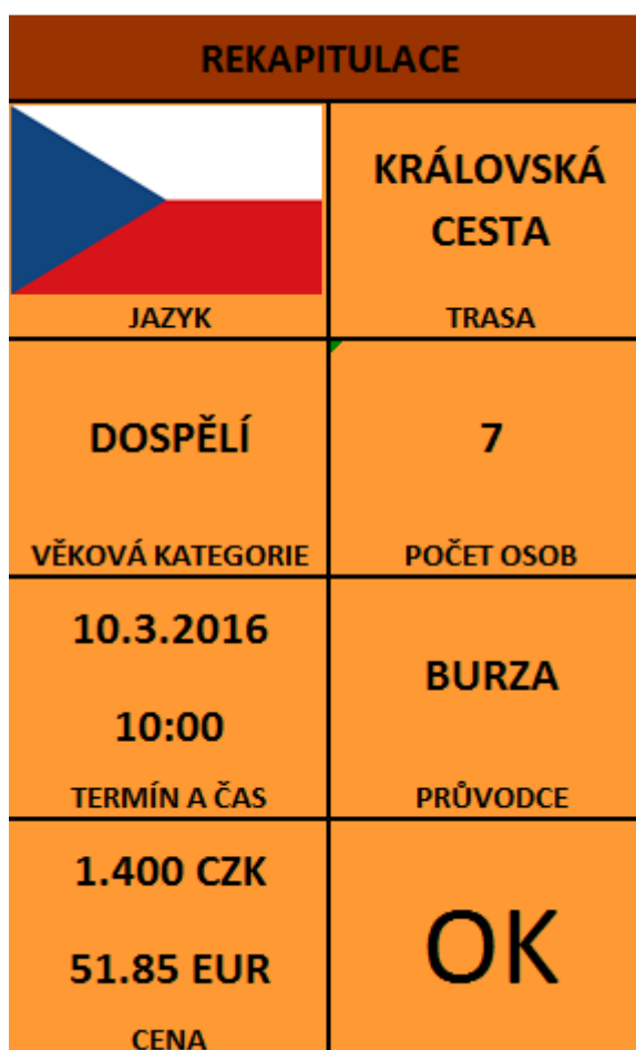
Obrázek 6 : Stránka s rekapitulací poptávky.

Na závěr by se objevila rekapitulace objednávky, kde by klient případně mohl upravit některý ze svých požadavků. Pokud by objednávku schválil, odeslala by se buď konkrétnímu průvodci anebo na burzu průvodců, kde by si ji mohl některý z průvodců převzít.