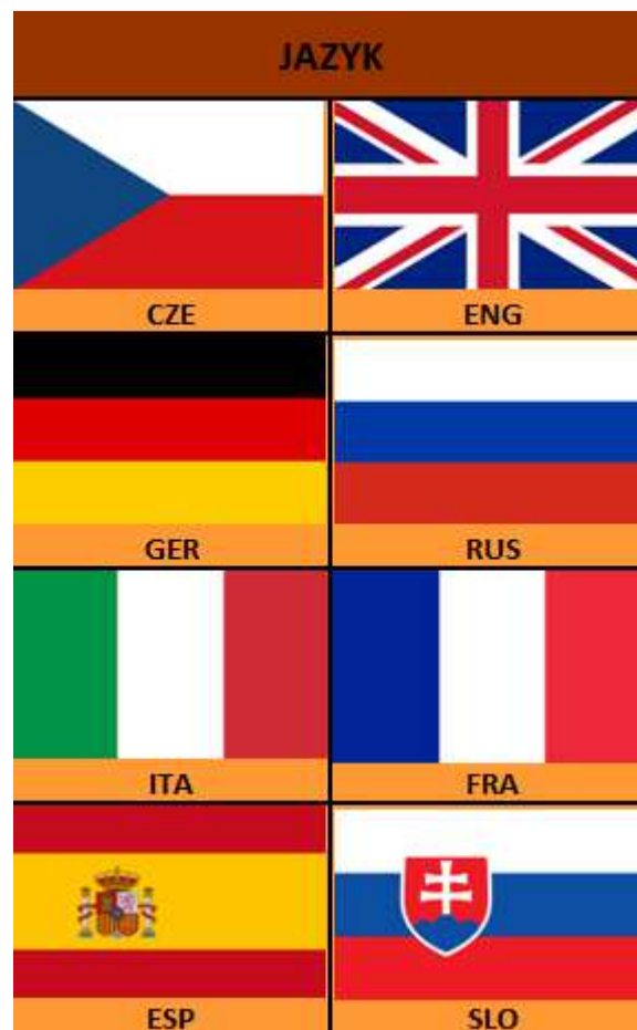
Obrázek č. 1 : Stránka s výběrem jazyka.

V úvodu nabízí mobilní aplikace možnost výběru jazyka. Výběr jazyka se provádí při otevření aplikace především z důvodu, že se dle jeho zvolení změní i jazyk celé aplikace. Současně bude klient ve zvoleném jazyce absolvovat prohlídku. Podle statistiky poskytnuté od Asociace průvodců ČR patří k nejčastěji poptávaným jazykům výkladu angličtina, němčina, ruština a italština. Jazyky jsou v okně aplikace řazeny právě podle četnosti objednávek s tím, že čeština je uváděna vždy na prvním místě. Po posunutí displeje se rozšíří možnost výběru jazyka o další jazyky. Jejich počet je stanoven podle počtu jazyků, které ovládají průvodci zaregistrovaní k aplikaci. Mohlo by se stát, že by v méně používaném jazyce jako je třeba korejština prováděl pouze jeden průvodce.